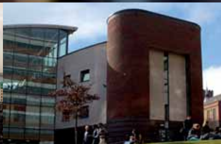
▲ Το Πανεπιστήμιο του Sheffield