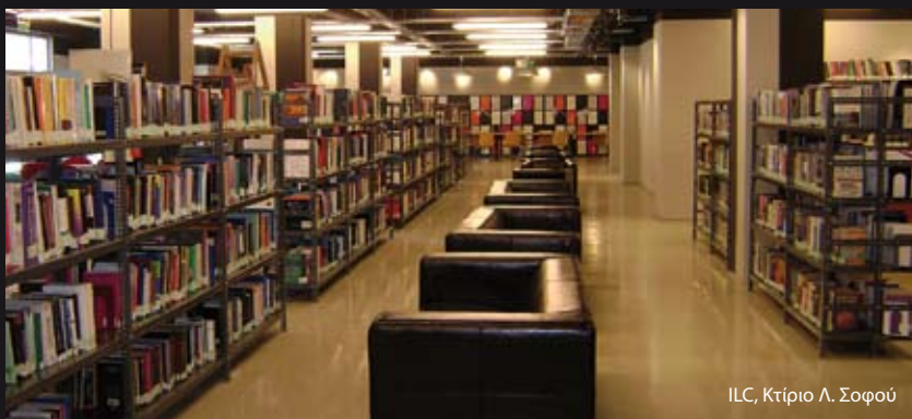
ILC, Κτίριο Λ. Σοφού